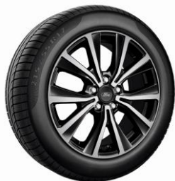
17" Titanium/Freeform Ilmített széria* Standard

2022.25-ös modellév - 2021/8 Érvényes: 2021. december 13-i gyártástól A változtatás jogát fenntartjuk!