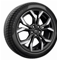
18" ST-Line X Standard