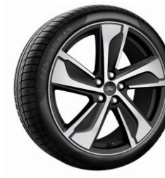
19" ST-Line/ST-Line X Külső Dizájn csomagban érhető el