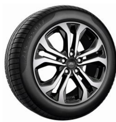
17" ST-Line Standard