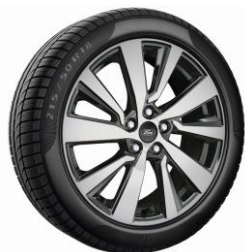
18" Titanium X Standard